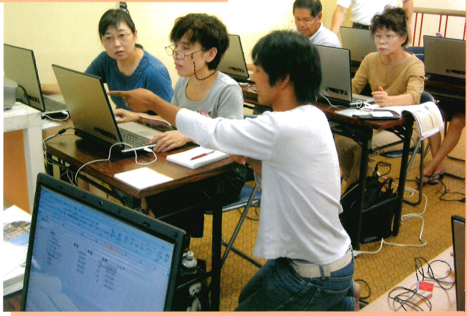
徳山高専による「パソコン若葉相談室スペシャル」